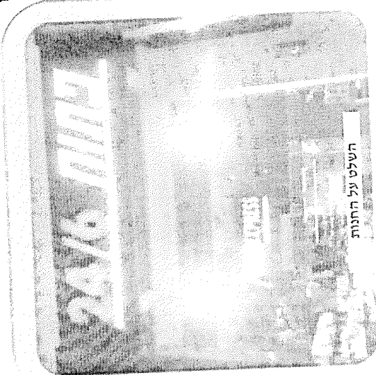
השלט על החנות

עשינו כדבריו, ומה נאמר ומה נדבר? - מסביב, חילולי שבת בהיקף שאי אפשר לתאר. חלק גדול מן החנויות, ובהן גם כוז המוכרת בשר-ד'א רח"ל, פתוחות בשבת, ומי שמכיר את מהלך העניינים יודע שלכל אורך יום המנוחה המקודשת של העם היהודי פוקדים המונים-המונים את 'תל השומר'.